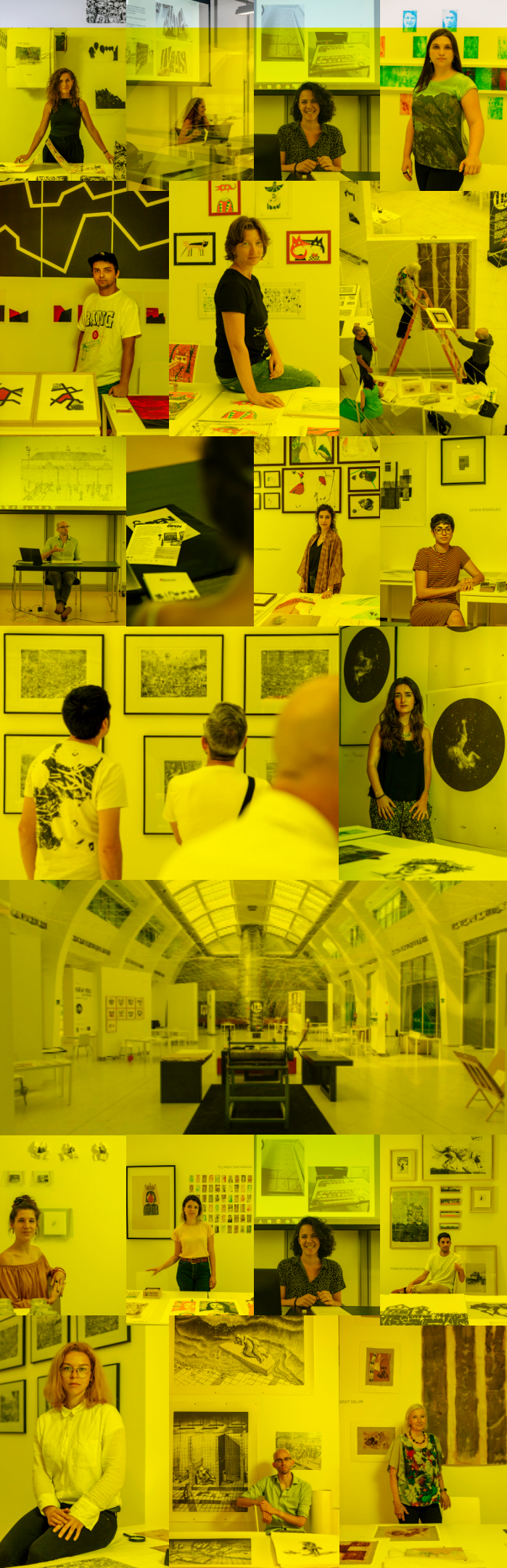
FIG BILBAO 2020 FESTIVAL INTERNACIONAL DE GRABADO Y ARTE SOBRE PAPEL DE BILBAO